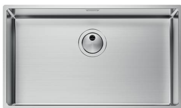
Évier S4001 3138 850