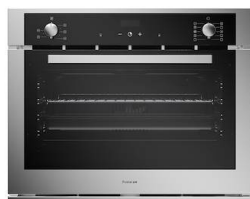
Four KE 75 7137 000